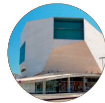
Casa da Música